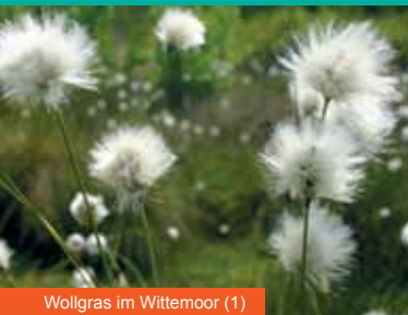
Wollgras im Wittemoor (1)

Wegbeschreibung: Start am Rathaus / Tourist-Information, rechts auf Parkstraße , Ampelkreuzung links in Königstraße , rechts in Wanderweg Geestrandgraben , schräg links in Friedrichstraße , geht am Ende halblinks über in In den Späten . An der Imbäke überqueren, geradeaus in Brookstraße (R) , dieser Straße ca. 5 km weiter folgen (R) .