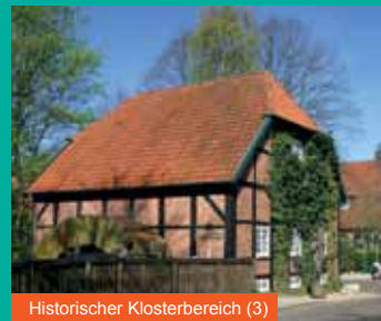
Historischer Klosterbereich (3)

Am Straßenende rechts in Maibuscher Straße , geht hinter Bahnlinie über in Neuenkooper Straße (R) , links abbiegen in Schulpfad , am Ende rechts abbiegen, bis zum Ende folgen. Links in Hoher Weg (R) abbiegen, geht über in unbefestigten Weg (R) (1), Bach über kleine Brücke queren. Abstecher zum Bohlenweg / Wegeheilige rechts möglich (2). Sandweg bis Ende fahren, links abbiegen, nächste Straße rechts abbiegen Hinterm Reiherholz , am Ende links auf Linteler Straße . An der Kirche links in Kirchstraße , an der Klosterruine vorbei (3), am Ende der Straße rechts in Parkstraße und bis zum Ausgangspunkt Rathaus / Tourist-Information zurück.